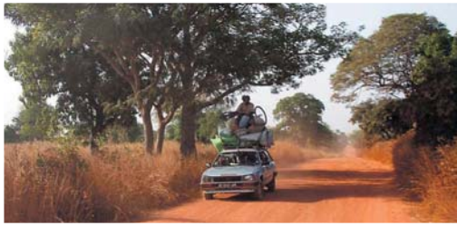
Fantasien som utvises blant de ulike kollektivmidlene her i Vest Afrika er formidabel. Hvor trafiksikkert det er, kan vel kanskje diskuteres.