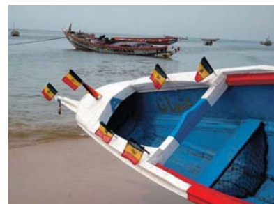
Fiskebåtene ligger klare i sjøkanten, her vakkert dekorert med Sengals flagg.