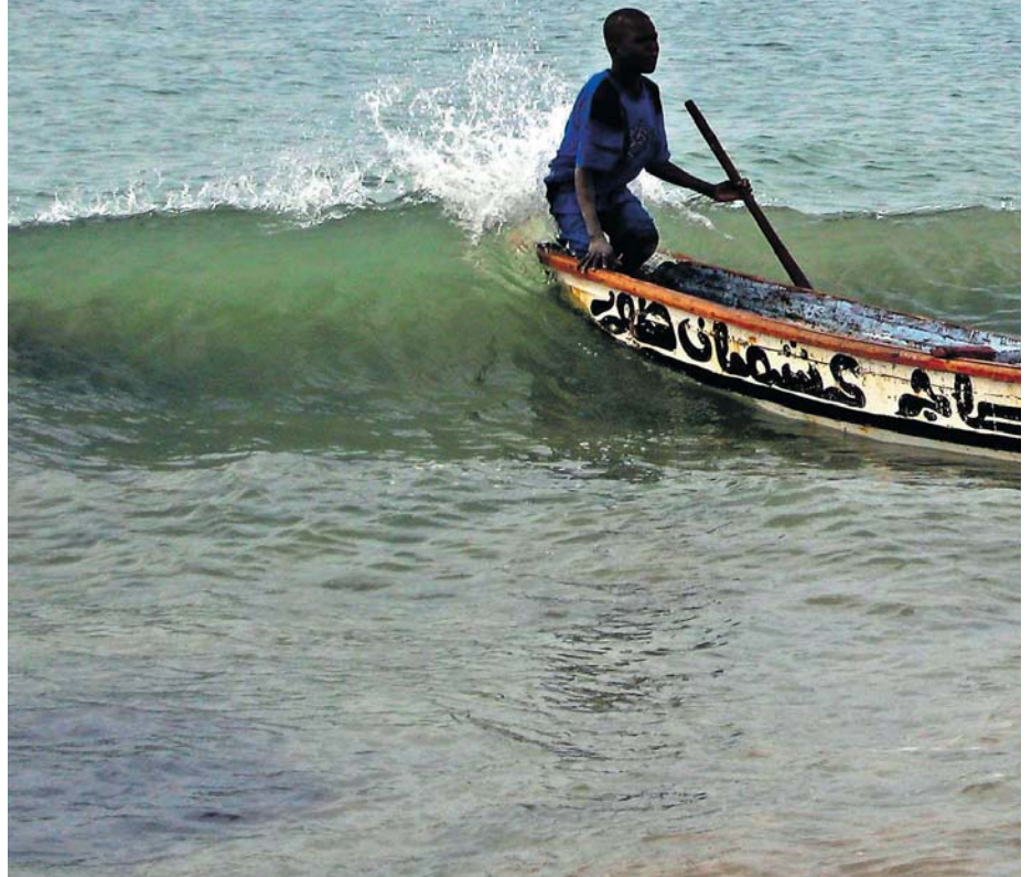
Vi bodde like ved fiskelandsbyen Mbour og det var hektisk aktivitet fra tidlig morgen.

Julen er en fantastisk tid dere... Tid til familiehygge, gjenforeninger og ettertanke. Julen er den tida på året hvor vi liker å gi litt ekstra til de vi er mest glad i og som står oss nærmest, og hvor vi har mulighet til å sette av tid til hverandre og bruke litt ekstra energi med å være snille og greie.