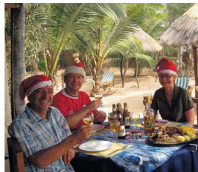
Pinnekjøtt på første juledag i god norsk juletradisjon.