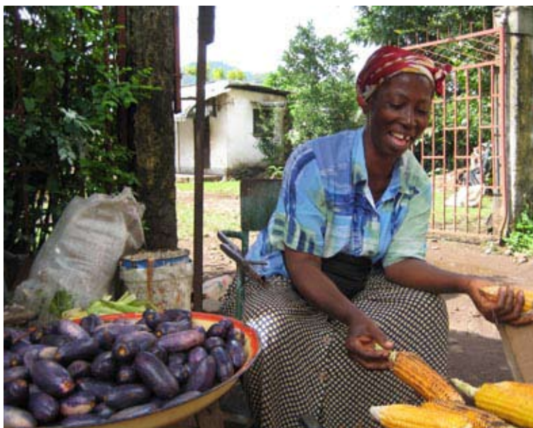
Vi kjøpte "en lett lunch" etter besøket hos dame gruppen.