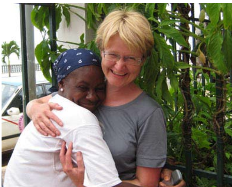
Du møter nye mennesker hele tiden og alle omfavner deg bokstavelig talt og åpner dører og hjem.